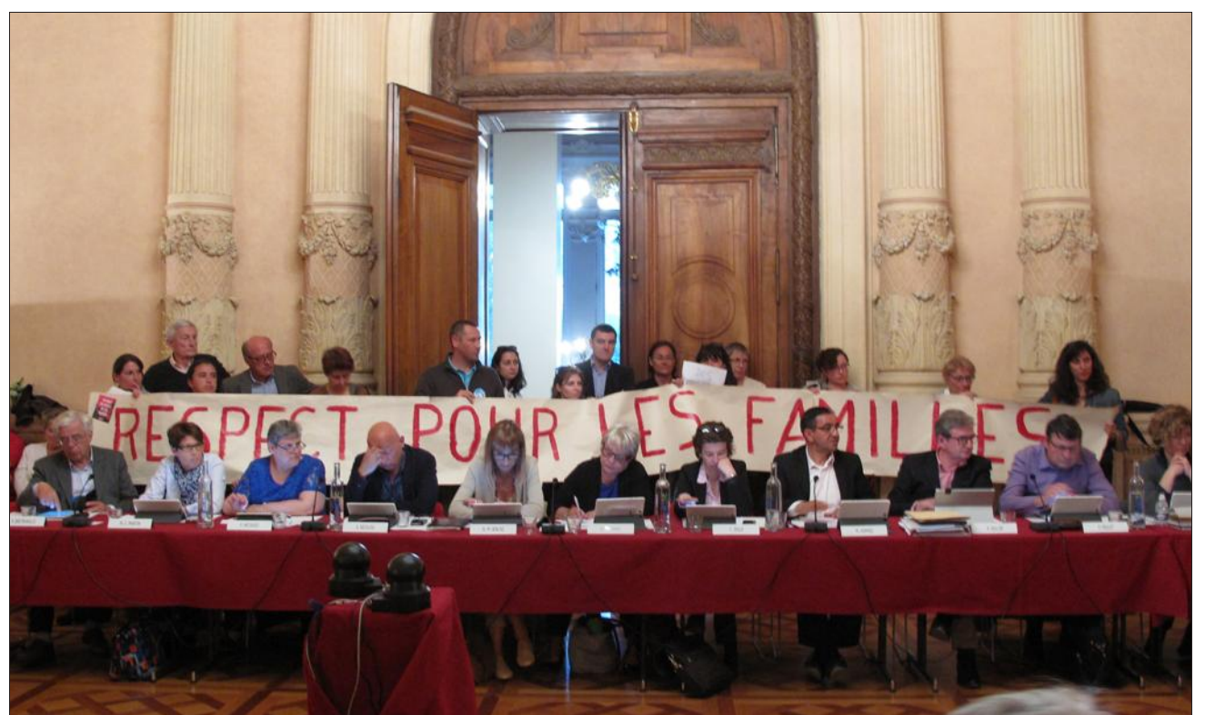
Une délégation de parents et enseignants contre le projet s'est rendue au conseil municipal, mardi soir.

Pour Michel Dantin, il s'agit d'une nécessité : « vétusté des infrastructures, effectifs scolaires en baisse, problèmes d'hygiène des sanitaires... » La décision sera effective dès juillet 2016 et les périmètres scolaires modifiés au 1 er septembre pour l'accueil des élèves dans les écoles des Combes, de la Grenouillère et de Vert bois. Jean-Pierre Ruffier, ancien premier adjoint de Bernadette Laclais (PS), s'inquiète des conséquences : « Vous vous attaquez au cœur du quartier [...] Aucune garantie du maintien de la mixité sociale n'a été démontrée jusqu'ici. »